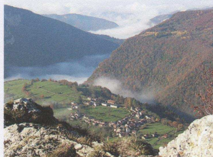
Un point de vue sur le village d'Oncieu depuis le col d'Evosges.

Parcours 70km : Départ de Tenay , Argis, St Rambert en Bugey, Col du Nivollet D63, l'Abergement de Varey, Château de Varey, Jujurieux, Cucuen, Chaux, Vieillard, Col de Montratier D11, Chatillon de Cornelle, Col du Cendrier (793m) D11a, Corlier, Aranc, Col des Pézières (810m) D34, Résinand, Oncieu (village pittoresque), Col d'Evosges (758m) D102, Evosges, le Chanay, Malix, Tenay.