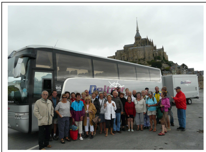
Retour pour le centre de vacances après un circuit vélo et pour certains, la traversée des grèves autour du Mont St Michel.